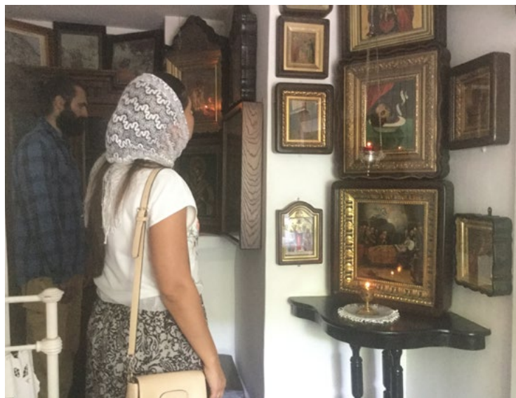
Паломники разсматриваютъ старинныя иконы внутри келліи.

Особенно любилъ посѣщать старецъ Успенскій соборъ, которому дѣлалъ много пожертвованій. Онъ часто заказывалъ