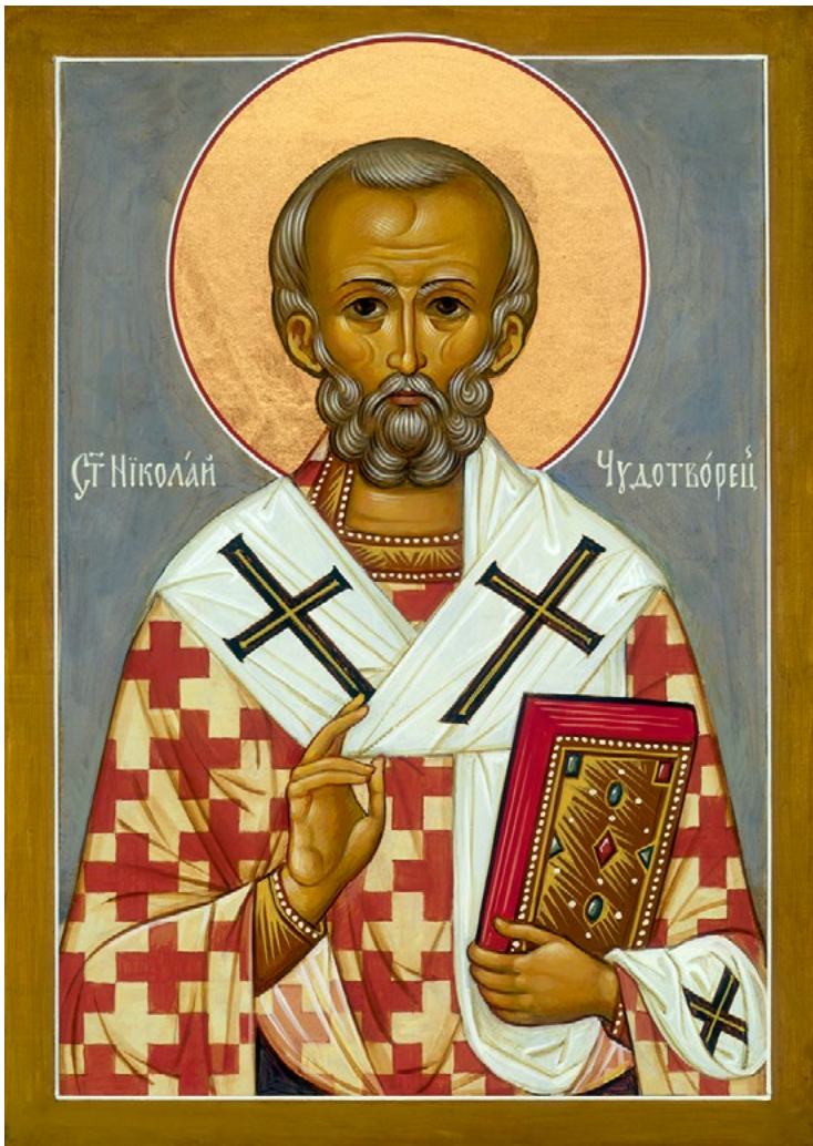
Святитель Николай чудотворецъ