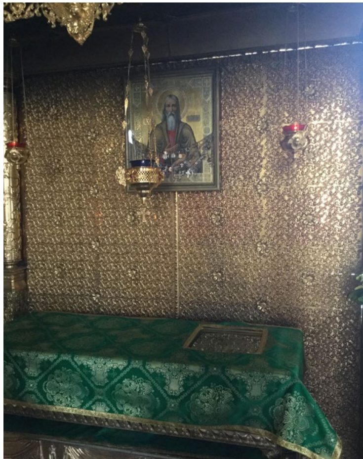
Рака съ мощами святого в св. Никольскомъ храмѣ г. Таганрога.

Сохранилось много свидѣтельствъ о чудесахъ, связанныхъ съ именемъ святого праведнаго Павла. Члены Комиссии по канонизации святыхъ Донской Митрополии собирали эти свидѣтельства в процессѣ подготовки къ общецерковному прославлению. Члены комиссии были поражены, какія