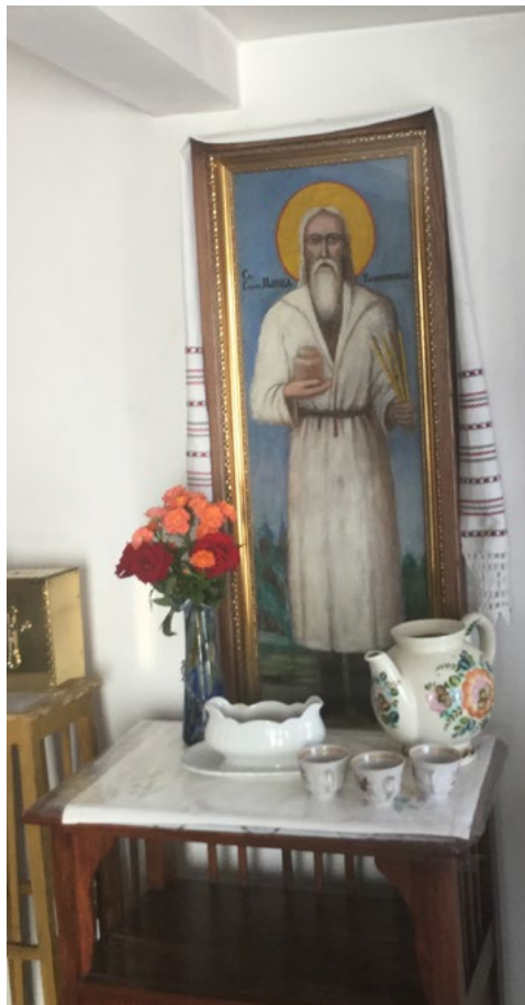
Икона св. Павла при входѣ въ его келлію, на фото также видны кувшинъ съ водой и блюдо съ баранками - ими угощаютъ паломниковъ какъ и св. Павелъ любилъ это дѣлать при жизни.

Прозрѣвая сердечное устроение каждаго, старецъ по-разному общался съ приходящими: однихъ строго смирялъ, жестко указывая на страсти, гнѣздящихся въ душѣ; другихъ же подводилъ къ раскаянію тихо и ласково. Люди, видя усердіе