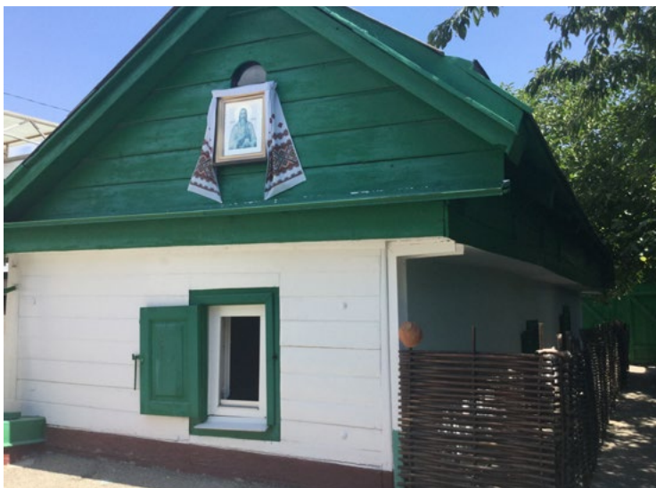
Внѣшній видъ келліи св. Павла по адресу Тургеневскій переулокъ, 82, (г. Таганрогъ) гдѣ онъ прожилъ всѣ свои годы жизни въ Таганрогѣ.

Уроженецъ Черниговской губерніи Павелъ Павловичъ Стожковъ, будущій святой праведный Павелъ, поселился въ Таганрогѣ приблизительно въ 20-хъ годахъ XIX вѣка, въ возрастѣ 30-35 лѣтъ. Извѣстно, что еще въ 16-ти лѣтнемъ возрастѣ юноша тайно покинулъ отчій домъ и цѣлый годъ путешествовалъ по монастырямъ, а когда вернулся домой, отецъ сурово наказалъ его. Состоятельные родители стремились обезпечить сыну образование и хорошее